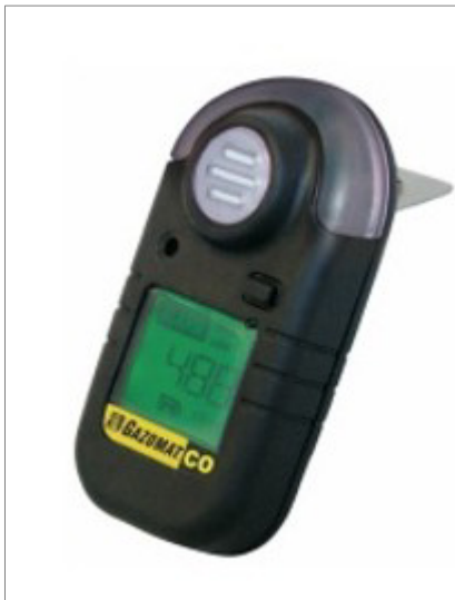
Tragbare Gaswarn- geräte