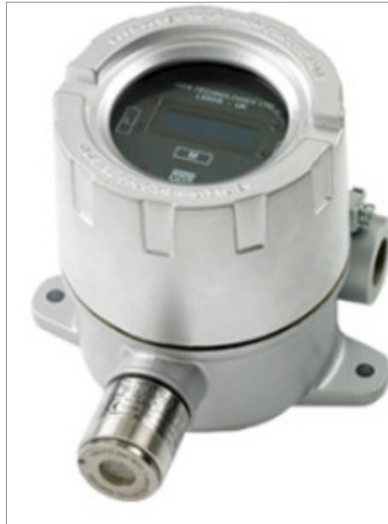
Stationäre Gaswarn- anlagen