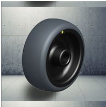
Rollen für Büro- stühle