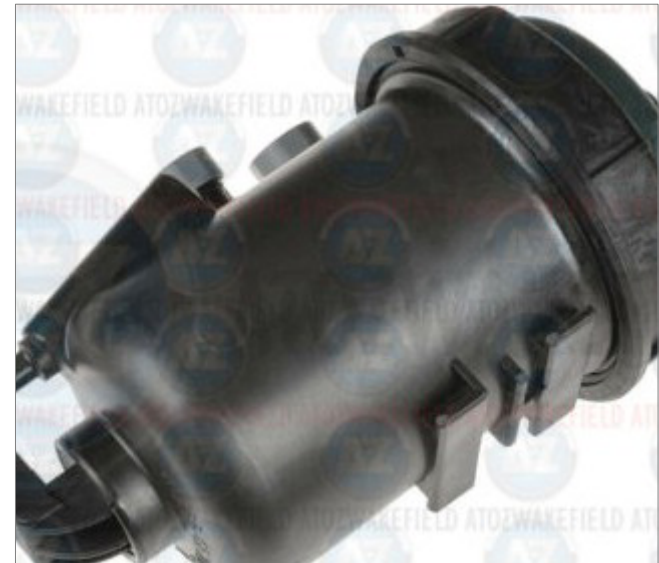
Gehäuse für Benzinfilter