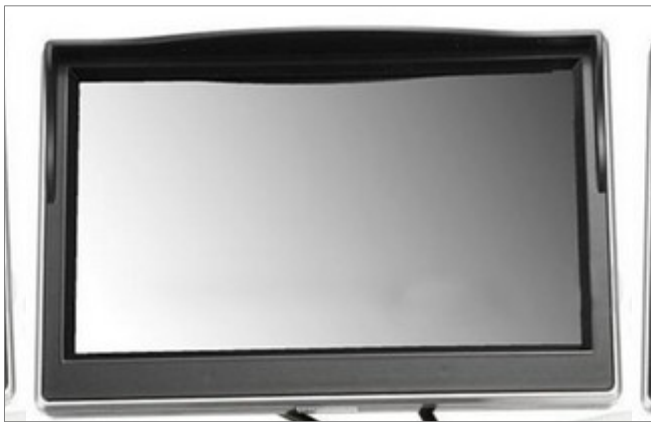
Bildschirm für GPS Navigationssystem im Auto