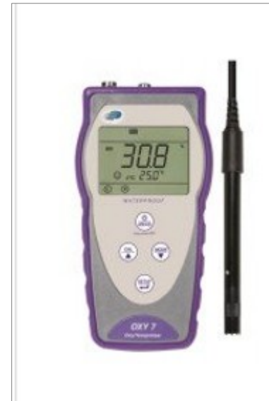
Gehäuse für Sauerstoff- messgerät